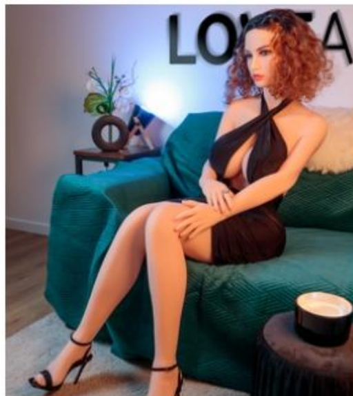
Poupée sexuelle réaliste Leila 1,67m